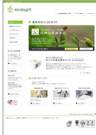
サイトのイメージ